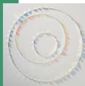
Keiko Mukaide Three Circles of Family Verre dichroïque sur bois

Devenu un rendez-vous attendu dans l'agenda de l'art contemporain, Lille Art Up! prend aujourd'hui une nouvelle dimension. Autour de la thématique de l'année - Transparences & Lumières - l'évènement nourrit son propos en coopération avec l'Université Catholique de Lille, La Piscine et le LaM. Cette première escapade de Lille Art Up! hors de nos murs s'inscrit dans la droite ligne de notre feuille stratégique. Lille Art Up! se festivalise et devient un évènement hybride, dessiné avec les acteurs de notre territoire. Lille Grand Palais joue ainsi plus encore son rôle de porte-drapeau de la destination Lille.