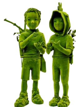
Kim Simonsson Moss People Utopia Lille3000