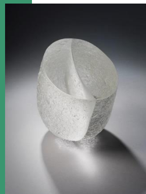
Bernard Dejonghe Meule Vive Verre moulé et poli